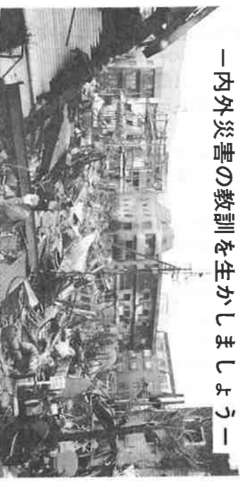
平成7年1月17日(火) 午前5時46分頃発生の淡路島を震源とするマグニチュード7.2の阪神大震災では、神戸市、淡路島、その周辺の地域に甚大な被害をおよぼしました。それは想像を絶したもので、改めて自然の力の脅威を考えさせられることとなりました。情報紙の紙面をお借りしまして、被災地の皆様に心よりお見舞い申し上げます。とともに、早期に復旧できますようお願い申し上げます。

さて、関東地方においても、いつ、このような大震災が起きないとは、言いきれません。現在、各家庭、地域そして行政等では、阪神大震災を教訓とし、防災について見直しをされていることと思います。地域情報紙「くがはら」編集委員会では、皆様に防災にたいだきたく、そのきっかけとなればと思います、防災についての特集を組んでみました。また、同時配布の防災地図は、各自自治会指定の一時集合場所及び避難道路が記載されています。参考にさせていただければ幸いです。