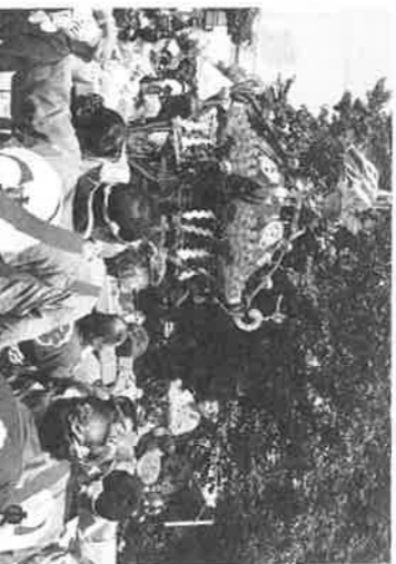
久が原東部八幡神社のお祭り ▲