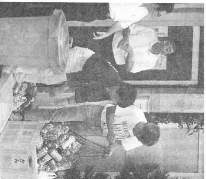
分別回収に協力してくださる皆さん

十月からは第一・第二の金曜日に回収します。皆さんの一層のご協力をお願いいたします。なお、出来るだけ早い時期に回収場所を併以上に増やしたいと考えています。回収のやり方をご覧になって、回収場所の責任者としてやってくださるお気持ちのある方は、お申し出くださいればありがたいと思っております。(東自治会担当 天野重夫)