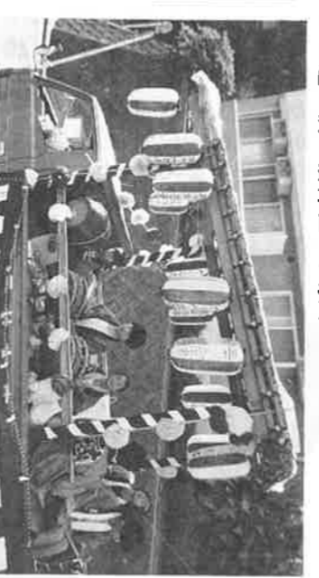
道々橋八幡神社のお祭り