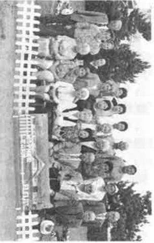
道々橋寿会親睦旅行にて