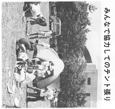
平成6年度夏休み子どもキャンプ