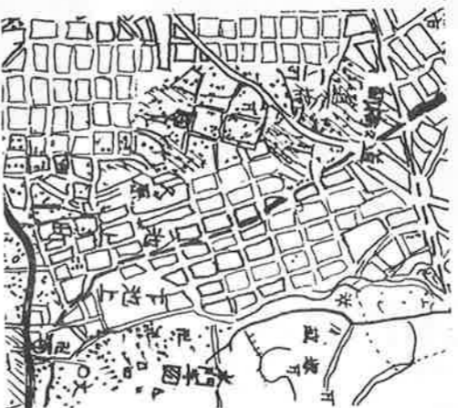
昭和7年(耕地整理後)

ですが、力を合わせて耕地整理を完成させた先人の努力に大いに感謝したいと思います。現在はその基本区画の中央に宅地化するための道(当時「は建築線と呼んだ」)が整理され、整然とした住宅地に変わっています。左の二枚の地図は、松仙小学校開校四十周年記念誌の記事からお借りした地図で、耕地整理をした様子を良く表しています。