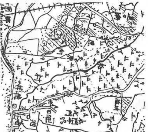
大正8年(耕地整理前)