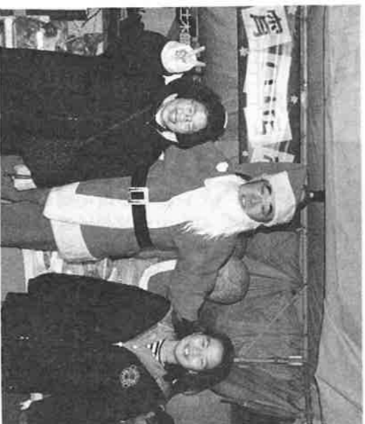
(一年間の感謝をこめた大イベント 12/23~12/24)