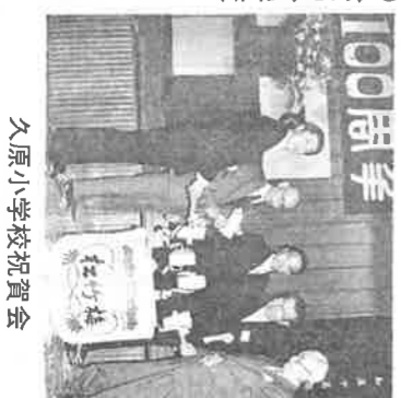
久原小学校祝賀会

職員、PTAの皆さんによる大変に息の揃ったコーラスで懇談を終わり、校歌斉唱、万歳三唱で会を閉じました。この百周年記念事業に協力して下さった多くの方々に感謝を申し上げると共に、久原小学校の更なる発展を祈りたいと思います。