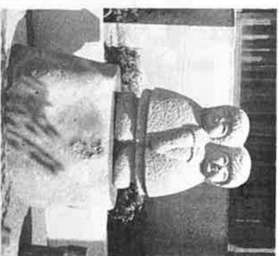
シンボルの「なかよし」