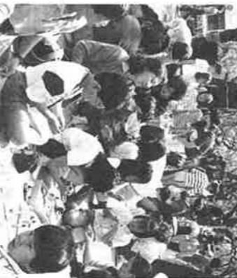
なにかができるのかな？ (手作りコーナ―)

話は前後しますが、昭和七年には、この辺りは東京市大森区の一部になりました。その後、満州事変を境に時代は軍国化し、地域の組織も「隣組」という形に統制されていったのでした。昭和十八年に、は都制がひかれ、やがて敗戦を経て、この間も、久が原クラブが所有してきた資産(土地)は、個人名で登記され、保存されてきました。 戦後の一時期、現在の東京朝鮮第六初級学校に使用され、ていまして、学校は、やがて千鳥町に移転していきまして千鳥町の所有地とな。その後、クラブの所有地百坪と借地二百坪を使用して、新しくクラブの集会所と児童公園が開設されました。このときの役員の方々のご苦労は、大変なものだったと思います。昭和二十七年に、地域住民一大イベントです。今年度は、久が原地区の責任担当で、「友達いっばい」夢いっばい」のテーマを掲げ、アスレチックや手作りコーナー、アドベントチャームゲームや煙体験など、いろいろなプログラムを用意し、実施しました。 昼休みには、道々橋八幡神社子どもお雛会のお雛子、大森第六中のアラスバンド、雪谷高校のチアリーダーズダンスなど、例年にない演奏や演技が参加者を楽しませてくれました。 久原、松仙、十中のPTAの皆さんも大活躍でした。三千二百五十人の参加者は、大いに遊び、楽しく愉快な一日をすごしました。 (新井信子)