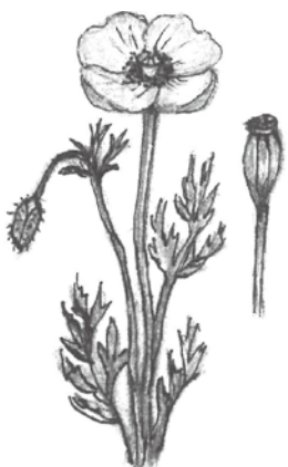
ナガミヒナゲシの花と種