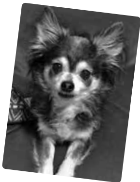
食欲旺盛な ジャックくん (オス 11歳)

シリーズ2回目は、2匹のワンちゃんのご紹介です。仲良くなれたらお散歩も楽しくなりますね。