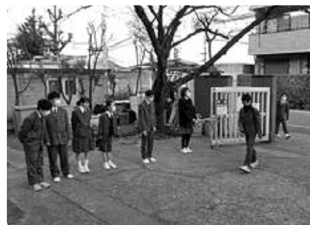
朝のあいさつ運動。「おはようございます!」

私たちはこのテーマをもとにして活動しています。例えば『十中生と遊ぼう』という活動では、遊びを通して、小学生や園児に十中生と触れ合ってもらい、十中のことや雰囲気を知ってもらうという目的で青少年対策委員会の方と協力して行っています。また、意見箱という箱を校内に設置し、学校の教育活動に対する意見や要望を常に募集しています。そして、定期的に意見をチェックし、十中のためになる意見かどうかを検討し、実行しています。この意見箱の活動によって、今までは禁止だった、冬場のタイツの使用を今年度から可能にすることができました。