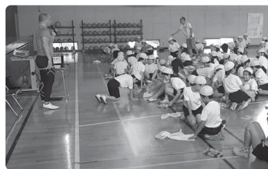
久原小 総合学習の様子

そんな方は、自分のあばら骨の下の方に手を当てて、あばら骨が広がらないようにしたまま、おなかを膨らます呼吸を練習してください。