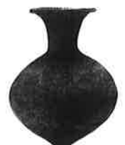
壺形土器 久ヶ原遺跡出土 (中根君郎氏寄贈資料・郷土博物館蔵)