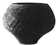
幾何学文壺 久ヶ原遺跡出土 (郷土博物館蔵)

久ヶ原式土器は3期に分類され、基本型とも言える1期から徐々に模様も複雑化しています。赤く彩色された壺に縄目の模様や幾何学模様などが施された美しい土器で、国の重要文化財に指定されたものもあります。一般的に弥生式土器は縄文式土器と違い模様のない土器と思っていたのですが、尾張以東は文様の多い土器のようで認識を新たにしました。久ヶ原式土器は郷土博物館の常設展示や久原小学校にも展示されていますし、国指定の重要文化財の土器は東京国立博物館でも見ることができます。また、特別展の図録は博物館で1000円で販売しています