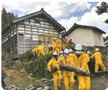
金沢工業大学の学生たちもボランティアとして応援してくれています。(穴水町)

共同募金会では、災害発生後、即座に災害支援を行えるように皆様からのご寄付金の一部を、災害等準備金として積立しています。この準備金は、被災県に設置の災害ボランティアセンターやボランティア団体の活動支援などに活用する共同募金独自の、災害時におけるたすけあいのしくみです。