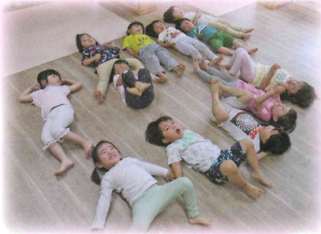
(N)KOTOともぞちネット 陽だまり保育園「こどもたちの保育室を整備しました。」

赤い羽根共同募金は子ども・家庭、高齢者、障がい者、まちづくりの推進など皆様に関わりのあるところで役立てられています。